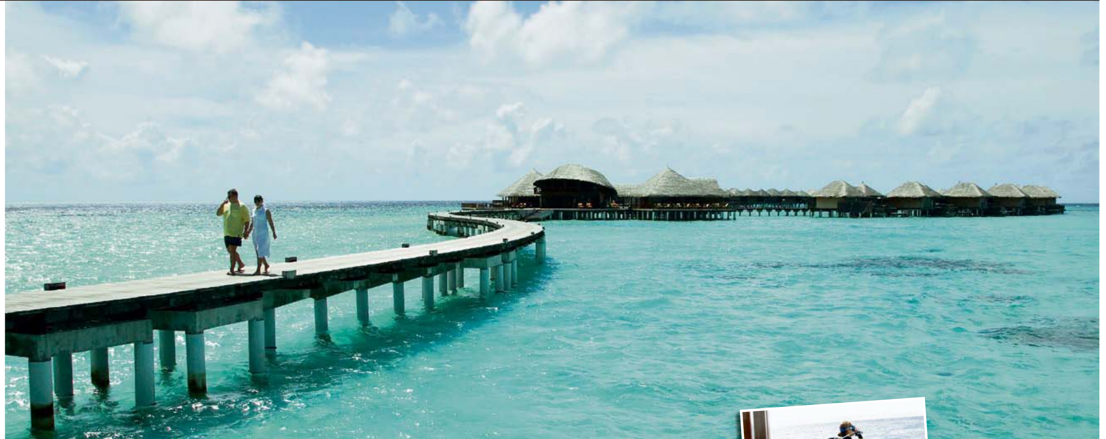
Hand in Hand das Ferienglück genießen: Honeymooners auf dem Steg im Coco Palm Bodu Hithi

Reif für die Luxusinsel: Drei Resorts auf den Malediven definieren Ferien neu