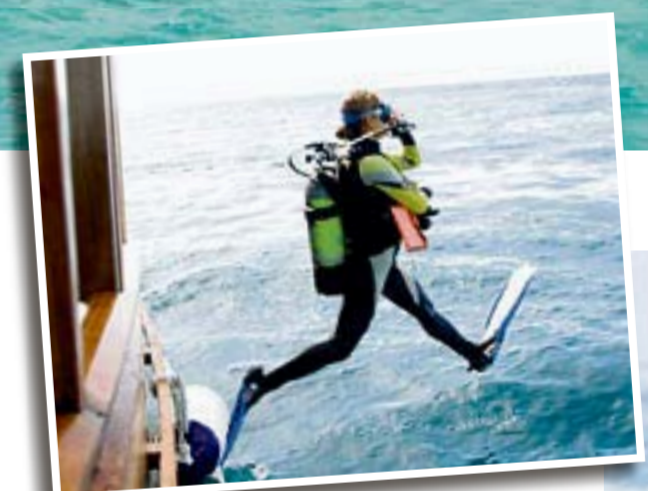
Tauchparadies Malediven: Zu entdecken gibts Haie, Muränen und Mantarochen