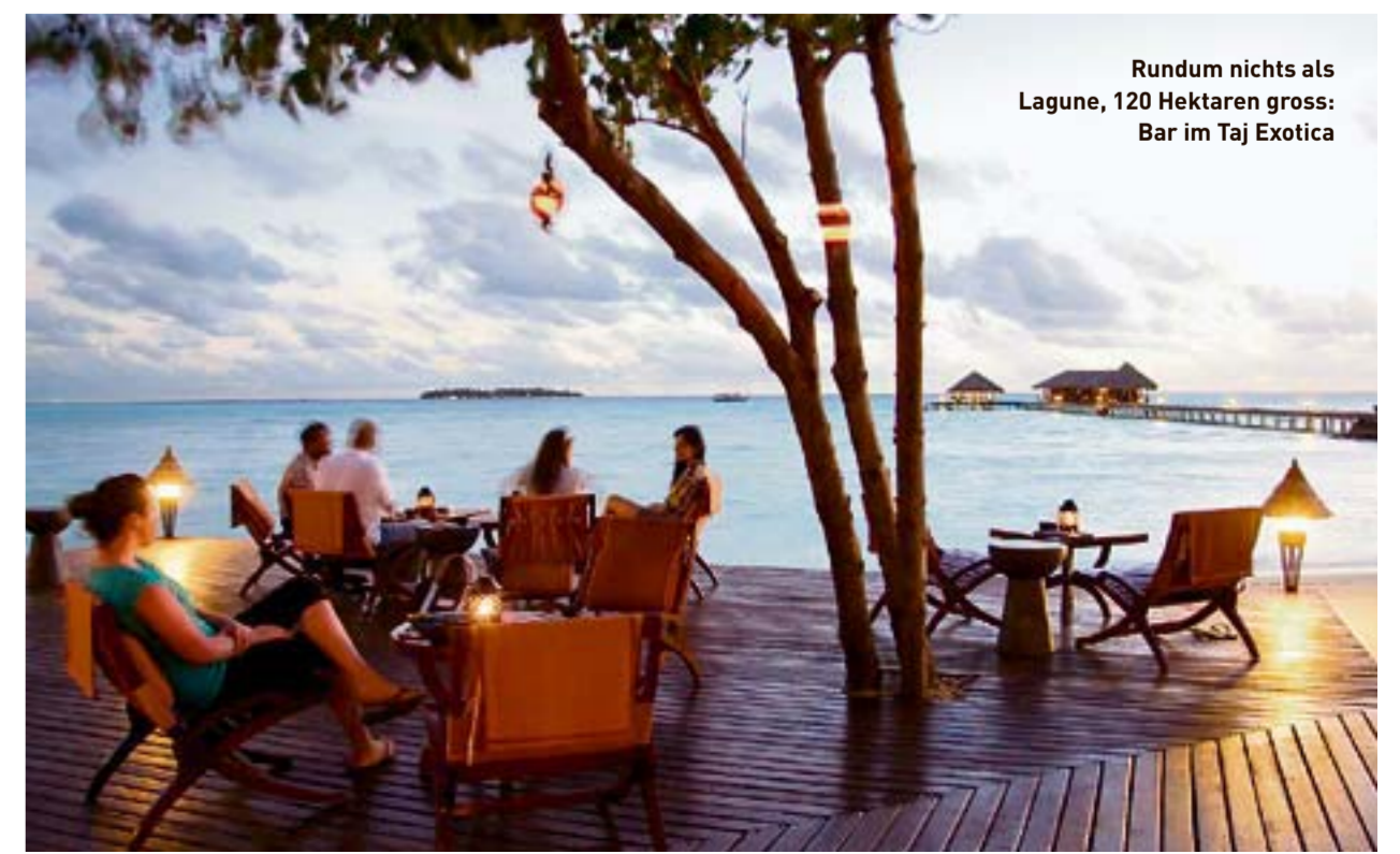
Rundum nichts als Lagune, 120 Hektaren gross: Bar im Taj Exotica