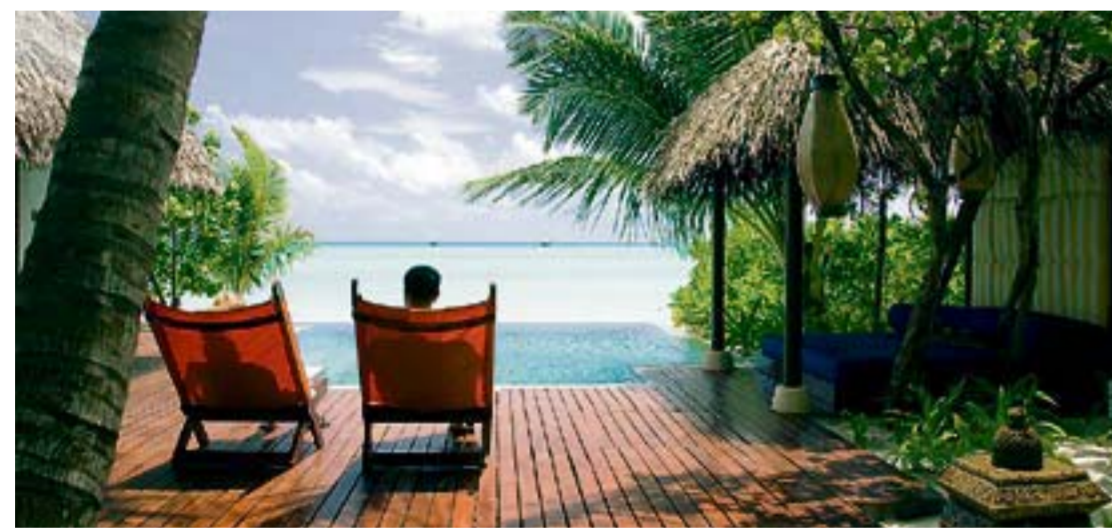
Faulenzen mit Blick aufs türkisfarbene Wasser: Bungalow im Taj Exotica

Als wir mit prallem Bauch in die Villa zurückkommen, ist das Schaubad eingelassen, auf dem Bett hat Roomboy Jemel mit Rosenblüten ein Herz geformt und «Goodbye» in ein Bananenblatt geritzt. Wir werden aus dem Paradies verlost – aber wie!