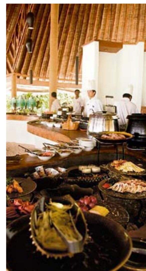
So beginnt man den Tag doch einfach gerne: Frühstücksbuffet im Island Hideaway

Anreise: Edelweiss Air fliegt zweimal wöchentlich von Zürich nach Malé, ab 1200 Franken, www.edelweissair.ch Reiseveranstalter: Manta Reisen, Zürich. Tel. 044 277 47 00, www.manta.ch . Der Spezialist für den Indischen Ozean. Unterkunft: Island Hideaway: Totale Privatsphäre, Dschungel-Feeling, privater Butler für jede der 43 Villen, hübscher Kids-Club, Hausruff nur 10 Meter vom Strand entfernt. Von Malé per Inlandflug (45 Minuten) plus Speedboot (30 Minuten) erreichbar. Eine Woche inkl. Flug/Transfers ab 3745 Franken pro Person (exklusiv bei Manta Reisen buchbar), www.island-hideaway.com Coco Palm Bodu Hithi: Coole Design-Lofts mit Privatpool und -strand, insgesamt 100 Villen, sehr schönes Spa über dem Wasser, viele Möglichkeiten für Aktivitäten, spezielle Honeymoon-Zeremonien. 40 Bootsmiuten nördlich von Malé. Eine Woche inkl. Flug/Transfers ab 3985 Franken pro Person, www.cocopal.com.mv Taj Exotica Resort & Spa: Sehr luxuriöse, grosszügige Villen (insgesamt 62), preisgekrönte Küche, romantische Bar mit Teleskop, Spa auf Ayurveda fokussiert, Tauchplätze per Boot erreichbar. 15 Bootsmiuten südlich von Malé. Eine Woche inkl. Flug/Transfers ab 4890 Franken pro Person, www.tajhotels.com Infos: www.visitmaldives.com