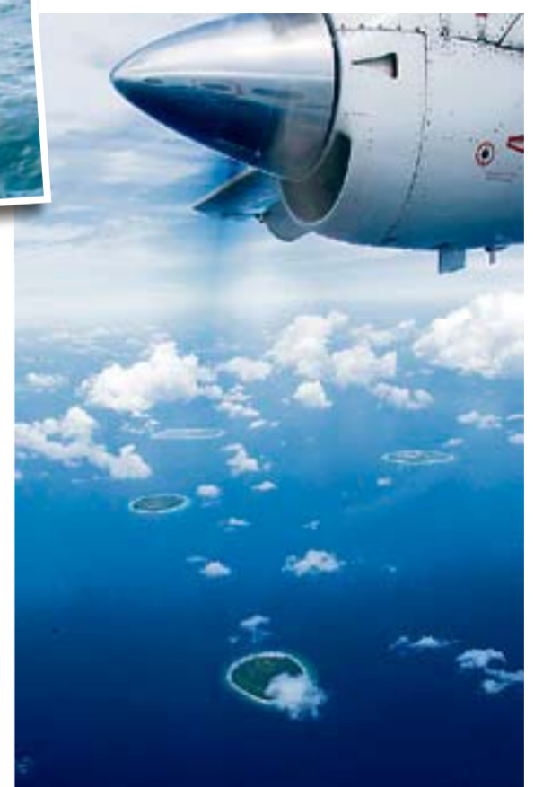
Inseln in Sicht: Ferienhungrige im Aufzug