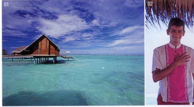
01 아시아의 정화(精華)를 풍기는 아름다운 리조트. 02 풋리추얼부터 집 꾸리기가까지, 게스트를 돌봐주는 버틀러.

개업 2005년 5월 전화 960-664-8800 객실수 수상 빌라 32개, 비치 빌라 98개 시설·서비스 레스토랑, 바, 풀, 스파, 버틀러 서비스 숙박료 비치 빌라 US$ 680~, 비치 빌라 워드 풀 US$ 980~, 콕터 빌라 US$ 1180~, 그랜드 워터 빌라 US$ 2360~ 홈페이지 www.oneandonlyresorts.com