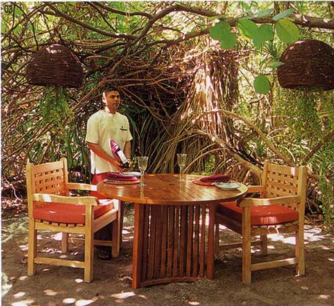
01 손으로 무무질한 것 같은 회반죽 벽은 빌라에 자연스러움을 더한다. 02 2층에 테라스가 마련된 '도나쿨리 스파'. 03 울창하게 자란 나무들로 가려진 정글에서 점심을 즐길 수 있다.